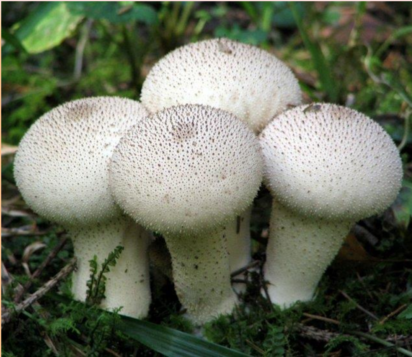
Гриб - дождевик